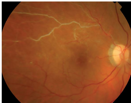
Afbeelding 1 (links): Fundusbeeld zonder kleurstof

Het doel van een fluorescentie-angiografie is het stellen van de diagnose / het mogelijk maken van de behandeling. De fluorescentie-angiografie wordt voornamelijk gebruikt om mogelijke afwijkingen aan netvlies, macula en/of bloedvaten in het oog in beeld te brengen.